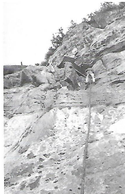
Pujada en corda al monestir de Debre Damo

Avui Etiòpia, que acull la seu de l'Organització de la Unió Africana (OUA), és coneguda per haver aprovat una de les constitucions més "avançades" de tots els Estats africans, una veritable referència, segons es diu, per al futur polític del continent. Això és el què explica, al menys, un estudiant belga amb el qual coincideixo al Baro Hotel de la capital. El text legal que regeix el què és ja un Estat Federal "reconeix el dret a