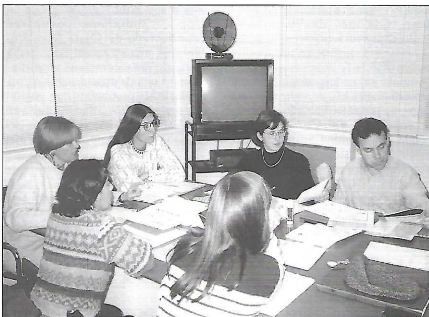
El Codi Ètic regularà el treball de les ONG.

Per tal de fer realitat aquests canvis, el Codi estableix com a unes de les funcions principals de les ONGD: influir en les institucions polítiques i administratives, establir vies de vinculació entre la societat i la tasca de les ONGD (a través de trobar formes de participació i compromís individual que